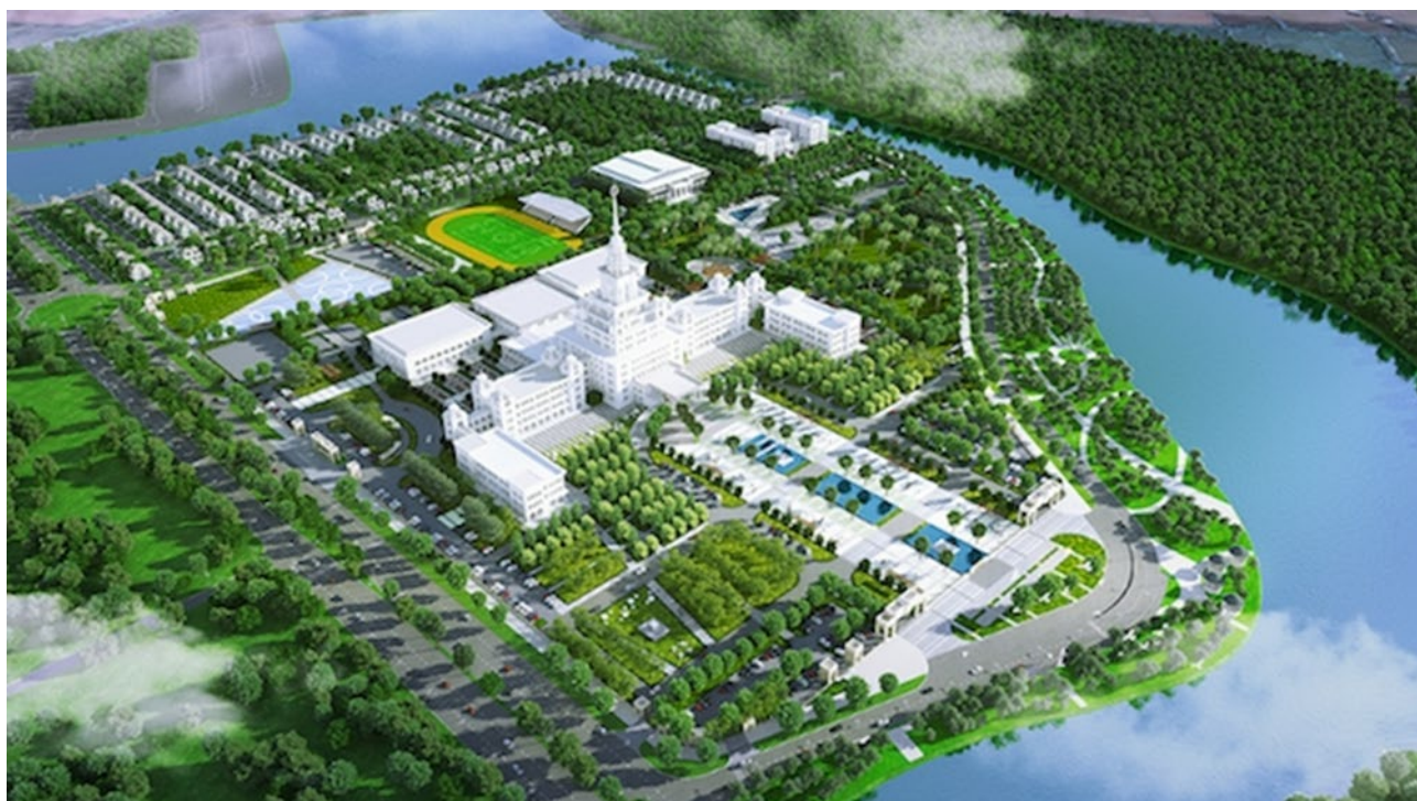
ビン大学キャンパスイメージ図

現在、ベトナム政府は2025年までに全大学に占める私立大学の割合を30%、私立大学に通う学生数の割合を22.5%に増加させることを目標としている(なお、2018年の同割合は27.6%、18.2%)。私立学校の設立は今後も内資・外資問わず参入があると見られており、当面の間拡大し続けることだろう。