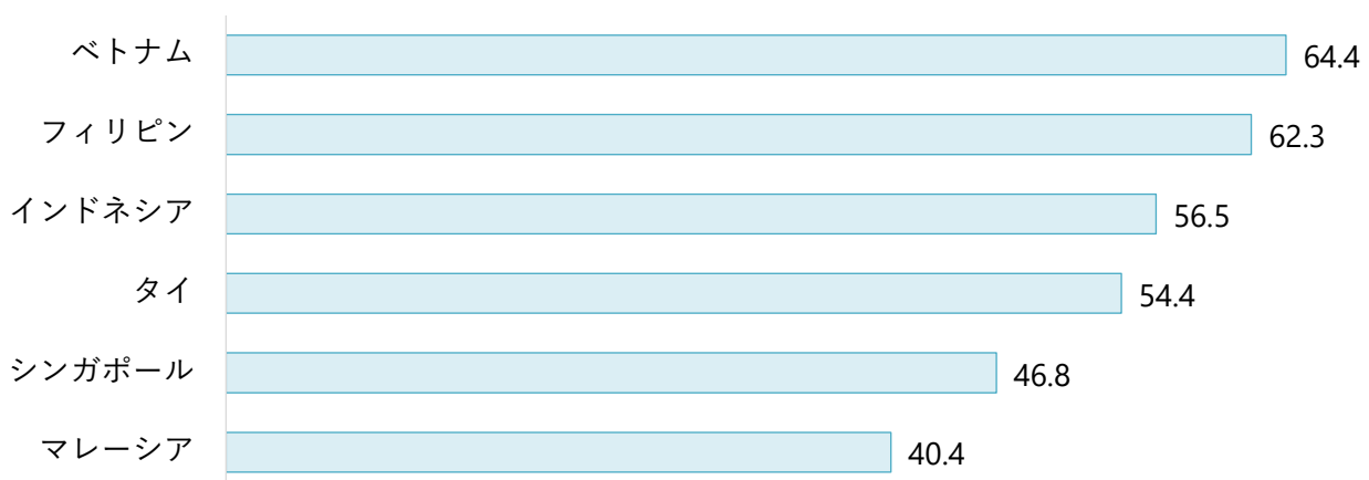
アジアクラウドコンピューティングの市場成長率（2010～2016年：%）